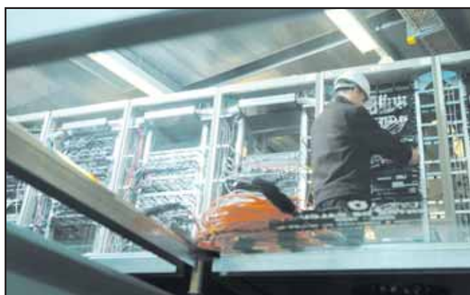
Le centre de traitement Unicable à Prilly.